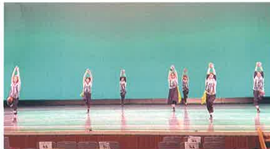
▲アサダ・ダンス・スタジオ