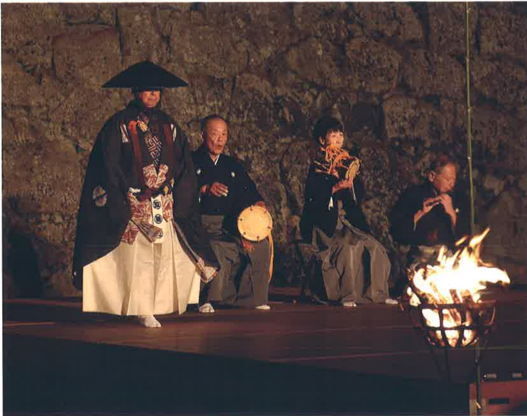
(写真はいずれも2019年撮影)