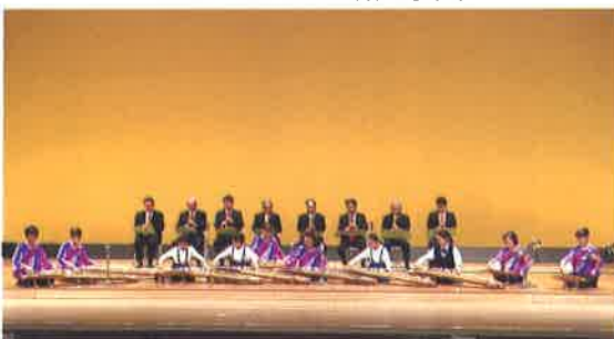
▲清の糸道合奏団と都山流尺八中予幹部会