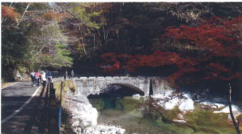
▶面河溪での川柳吟行風景

松山市文化協会は、松山市内で活動 する各分野の文化団体等の連携や新た な文化の創造を図ることを目的に、市民 文化祭や会員主催事業の後援など、各 種文化事業を実施しています。多くの文 化団体のご入会をお待ちしております。 また、協会の目的に賛同、後援いただ く賛助会員もあわせて募集しています。 お気軽にお問い合わせください。