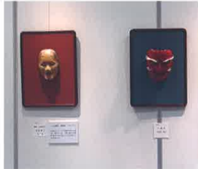
▲特別鑑賞会も三密を避けて作品の脇に評価ポイントを掲出しました