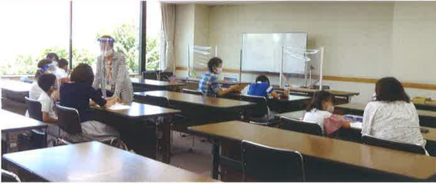
▲親子俳句教室の様子▼

8月17日・18日に松山総合コミュニティセンター会議室で、「松山俳句協会」協力による「親子俳句教室」を開催しました。 松山俳句協会より3名の講師を迎え、俳句の基礎を学び、その場で感じたこと、思ったことを俳句にしてみました。お友だちの俳句を聞いたり、作った俳句を選んでもらうことで、とても嬉しそうにしていました。