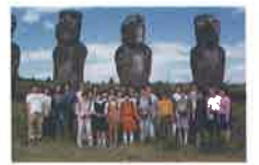
イースター島のモアイ像の前にて

* 郷土愛媛と国際社会を考える会事務局：〒790-0045松山市余戸中2丁目7-5 TEL/FAX*089-973-0245 E-mail:goodwill@fwajapan.com *