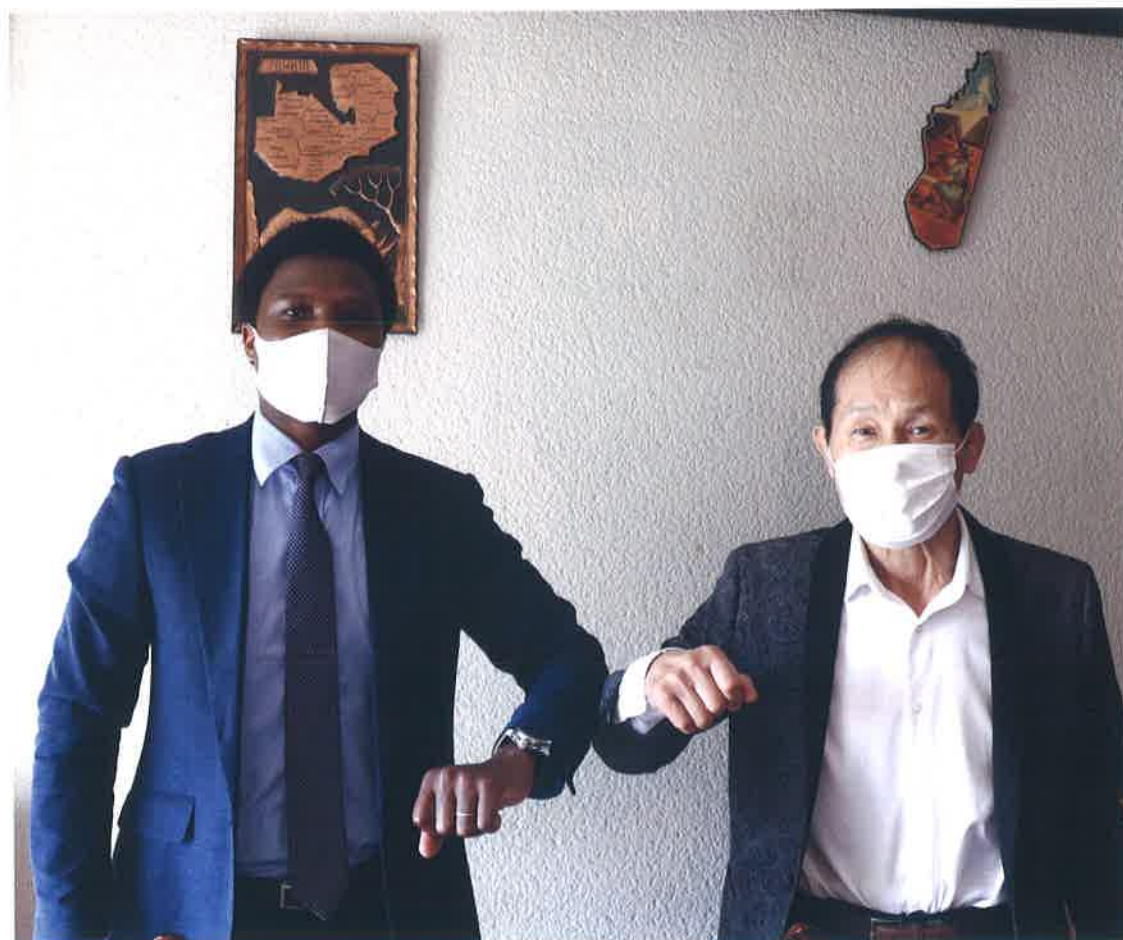
▲時節柄、マスクを着用での撮影となりました。