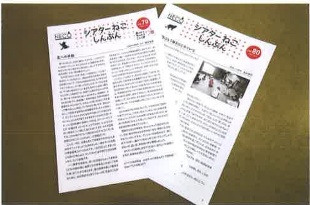
▲月1回発行されている「シアターねこ しんぶん」

「シアターねこ」では、もちろん演劇も上演しますが、様々なスタイルの文化イベントや、ライブや落語などの公演も行っています。劇場は舞台、音響、照明を完備しており、客席は98席あります。若い人たちには、是非こういうフリーな発表の場を利用してもらいたいと思っ