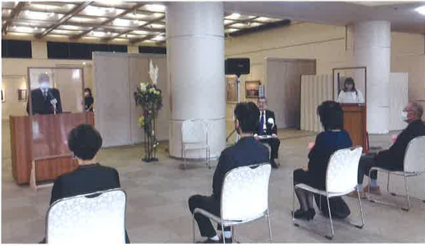
▲3密を避けて行われた美術展式典

この美術展は、市内の美術愛好家の創作活動発表の場として、また市民が身近な芸術に触れる機会として定着しています。今回は感染症防止対策を徹底して実施。開展式は規模を縮小して開催、審査員による特別鑑賞会も三密を避けるため作品脇に評価のポイントを掲出しました。会期中は約750人の来場者があり、展示された力作に見入っていました。