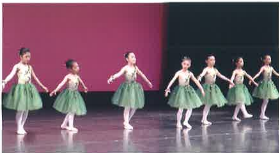
▲みあきバレエ研究学園