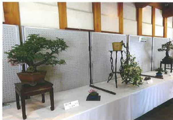
▲日本盆栽協会 松山支部