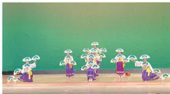
▲伊予万才石手つくし会