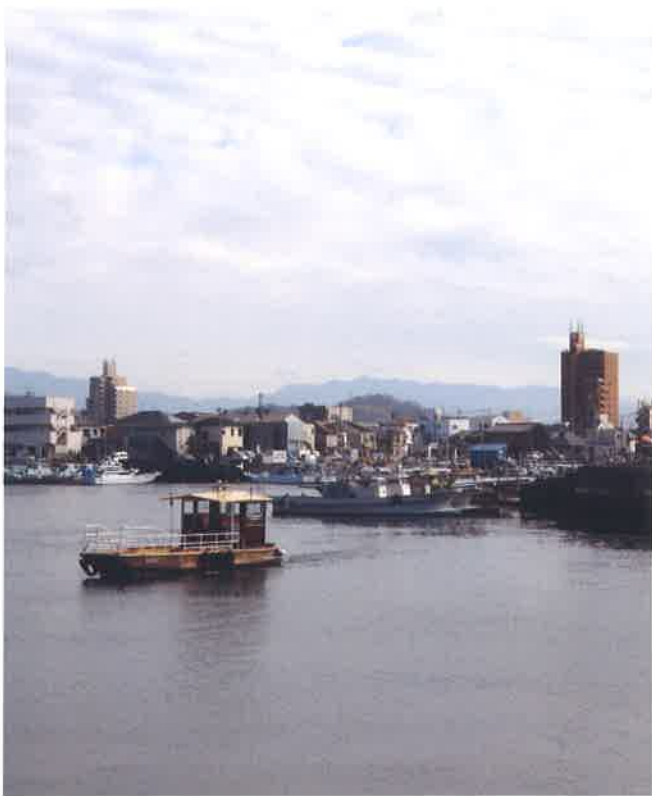
▲三津浜港の風景。伴野朗は1936年、松山市三津浜に生まれた。（港山側からみた三津内港）

三津浜をも登場させる手際の冴えは印象深い。最後に、もう一つエピソードを紹介しておこう。松山北高時代、当時の大相撲で大関であった三根山（高島部屋）の大ファ