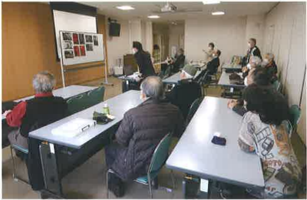
▲選出された作品を鑑賞して意見を述べ合う勉強会の様子

年1回の写真展は、毎年フジグラン松山のギャラリーで開催していますが、今年で28年目を迎えます。コロナの影響